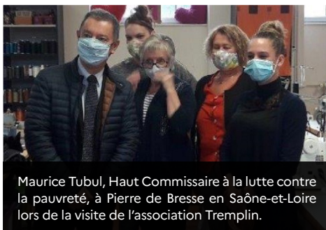
Maurice Tubul, Haut Commissaire à la lutte contre la pauvreté, à Pierre de Bresse en Saône-et-Loire lors de la visite de l'association Tremplin.

Le plan de relance national mobilise 100 millions d'euros pour soutenir les associations de lutte contre la pauvreté.